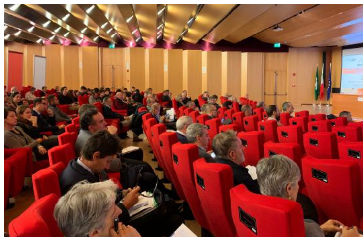
La platea dell'assemblea di ieri nel salone della Camera di Commercio di Lecco

Il tasso di disoccupazione Istat in provincia di Como si è ridotto dall'8,4% del 2017 al 7,3% del 2018. La popolazione inattiva è scesa a 106mila unità, con una flessione del 4,4% rispetto al 2017