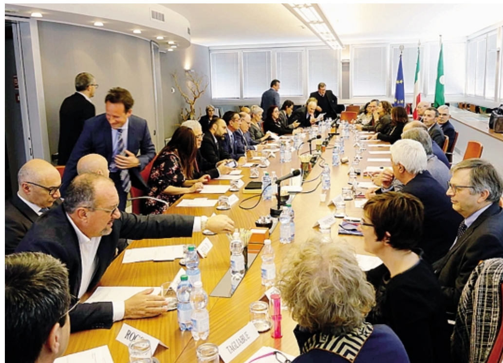
Tutti al tavolo della nuova Camera di commercio

La sfida che si apre è allettante: «Accompagnare e stimolare, in maniera consapevole e con ambiziosi obiettivi strategici, questo processo di convergenza, svolgendo un forte ruolo propositivo e di aggregazione di tutti gli attori del territorio e non solo».