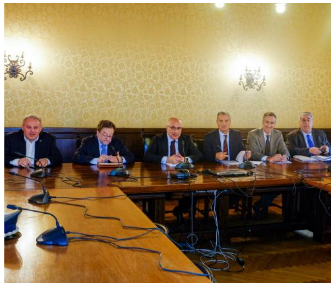
La firma del protocollo d'intesa ieri mattina in Prefettura a Como