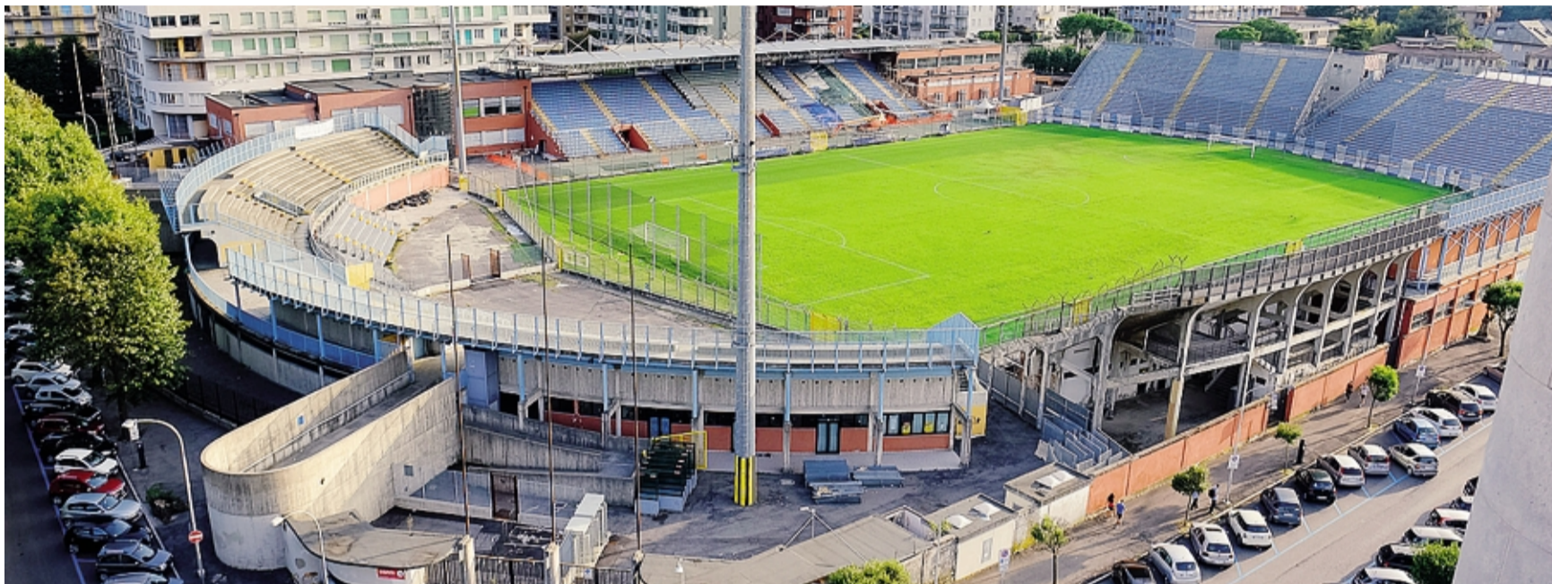
Lo stadio Sinigaglia venne inaugurato nel 1927: si tratta di un monumento vincolato dalla Soprintendenza