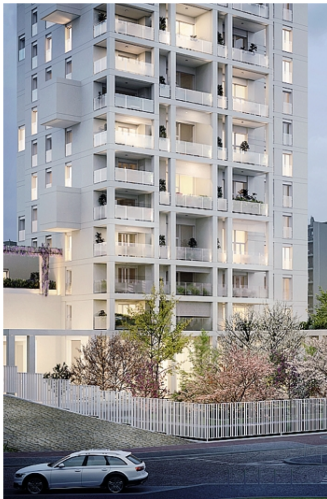
Un rendering dell'edificio: 23 i piani fuori terra, sarà alto 80 metri