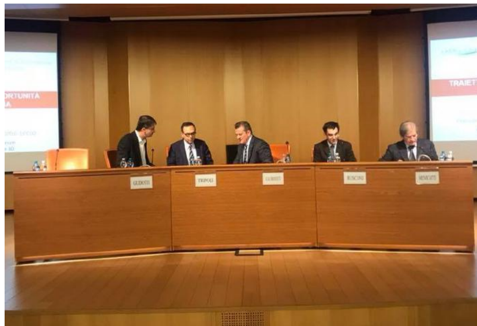
Il tavolo dei relatori della XVII Giornata dell'Economia durante la quale sono stati presentati i dati relativi a Como e Lecco

Nel primo semestre 2019 si è interrotto il trend positivo delle esportazioni, che a Como hanno fatto segnare un -4%, quasi tutto concentrato nel settore tessile. Le importazioni sono rimaste stabili, +0,1%