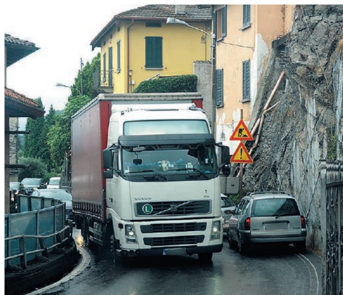
I disagi quotidiani, soprattutto quando c'è il passaggio dei mezzi pesanti